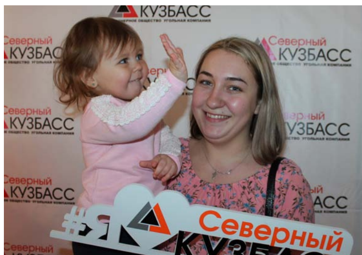
Самая юная участница праздника