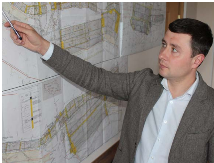
Общий объем запасов – более 267 млн тонн угля